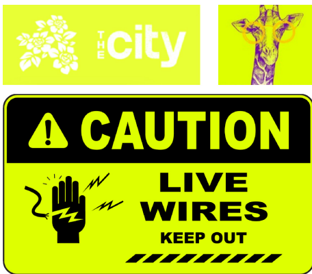
Efecte localizate și globale

Când aveți nevoie să sporiți valoarea lucrărilor de imprimare digitală, iGen® 5 este soluția ideală. Designerii pot crea fișiere cu toner galben fluorescent peste sau alături de CMYK, amplificând conținutul paginii și evidențiind cât se poate de clar mesajele-cheie.