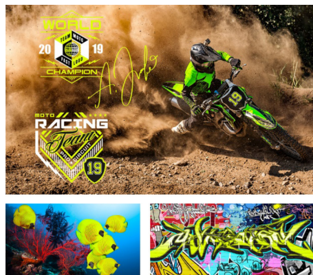
Optimizări foto și de culoare