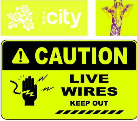
Nokta ve Akış Efektleri

Dijital baskı işlerinizin değerini yükseltmeniz gerektiğinde iGen® 5 talebinizi yerine getirir. Tasarımcılar CMYK üzerinde ya da ötesinde Floresan Sarı çalıştıracak dosyalar oluşturabilir, sayfa içeriğini iyileştirebilir ve kritik mesajları öne çıkarabilir.