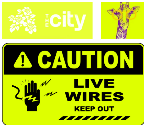
Efectos puntuales y de relleno

Cuando necesite aumentar el valor de sus trabajos de impresión digital, iGen® 5 cumple con lo prometido. Los diseñadores pueden crear archivos que procesen el amarillo fluorescente encima o junto a CMYK, de modo que se amplifique el contenido de la página y resalten los mensajes importantes, con orgullo y elegancia.