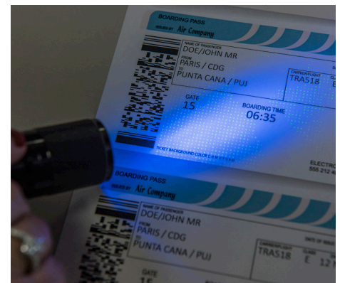
Marcas de agua