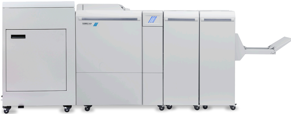
Criador de livretos Plockmatic Pro50/35, fabricado pela Plockmatic International AB

Crie livretos de qualidade profissional na velocidade nominal com uma solução em linha compacta e acessível.